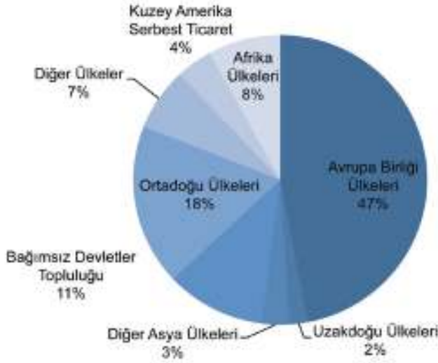
Tablo 2- Ülke Grupları Bazında İhracat Miktarı (%)